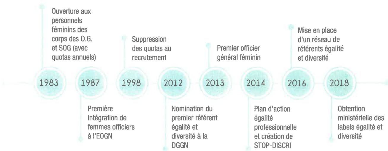
UNE AUGMENTATION DES FEMMES MILITAIRES DEPUIS LA FIN DES QUOTAS