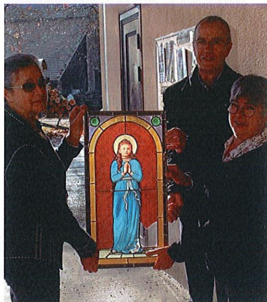
(Extrait article La Montagne, le 28/11/2018)

Le vitrail a maintenant retrouvé sa place dans la petite chapelle.